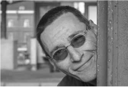
Le compositeur Luc Brewaeys.

plus de circonspection possible : un effort minimal pour un effet maximal. Ici et là, j'orchestre évidemment la pédale du piano. Le plus grand défi, cependant, consistait à concevoir des solutions orchestrales aux traits typiquement pianistiques. Même si je possède pas mal d'expérience dans l'écriture pour orchestre, j'ai néanmoins beaucoup appris pour mes œuvres futures en travaillant à (ou, mieux encore, en vivant avec) ces Préludes, et ce, pendant une période longue et particulièrement intense.