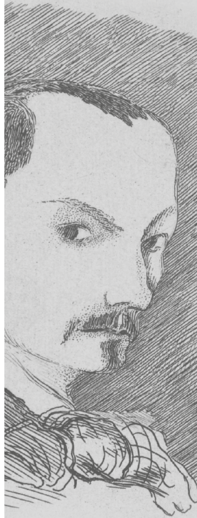
Charles Baudelaire, autportrait, 1848.

Longtemps ! toujours ! ma main dans ta crinière lourde Sèmera le rubis, la perle et le saphir, Afin qu'à mon désir tu ne sois jamais sourde ! N'es-tu pas l'oasis où je rêve, et la gourde Où je hume à longs traits le vin du souvenir ?