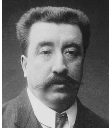
Camille Chevillard, chef d'orchestre.

les bras au ciel et n'invectivez pas la Méditerranée... il s'agit de deux pauvres petits jours. » (mars 1905)