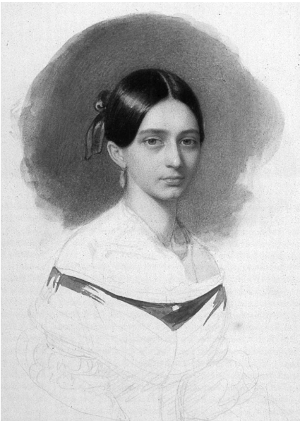
Clara Wieck, en 1840.

Schumann avait d'abord ajouté des sous-titres aux quatre mouvements : Frühlingsbeginn (« Éveil du printemps ») pour le mouvement initial, Abend (« Soir ») pour le mouvement lent, Frohe Gespielen (« Jeux joyeux ») pour le scherzo, et Voller Frühling (« Plénitude du printemps ») pour le finale. Ces indications anecdotiques ont finalement été gommées.